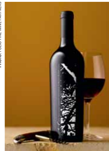
Das Meisterstück: «M by Michael Mondavi».

"M by Michael Mondavi": the masterpiece.